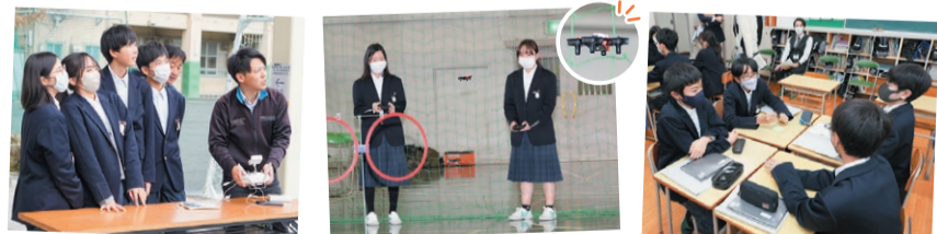
ドローンをプログラミングで飛ばしてみる