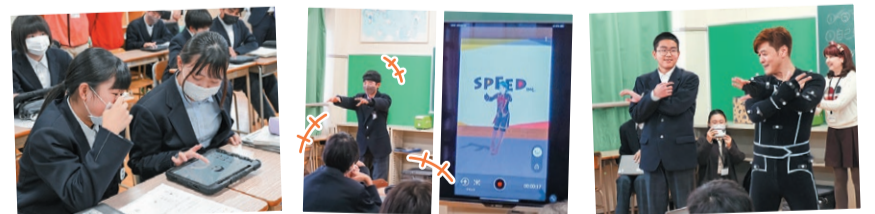
どんなアバターの設定にするか作戦会議