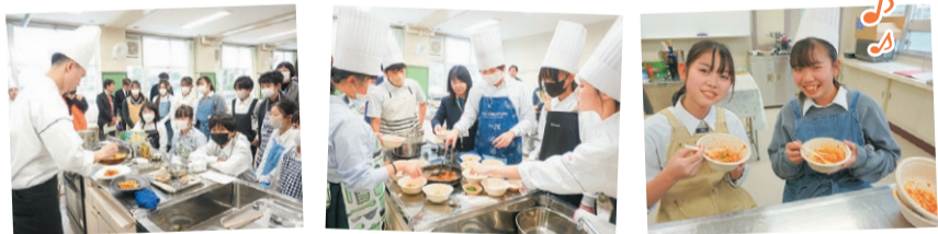
プロの調理技術を間近で体験