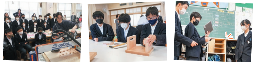
自分たちのアイデアが3D技術で、すぐ形に