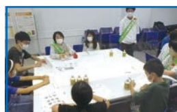
親子向けイベント