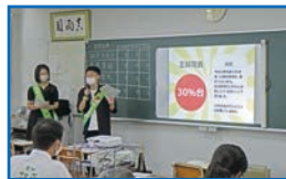
愛知サマーセミナー