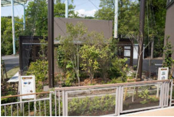
屋外運動場（コサンケイ）

動物の姿を間近に観察できるビューイングトンネルや、三次元的に動く姿を観察できる屋外運動場等を整備しました。