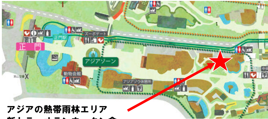
アジアの熱帯雨林エリア 新トラ・オランウータン舎