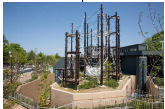
屋外運動場（スマトラオランウータン）

※約15mにもなるタワーや、樹木のようにしなるスウェイポールなど熱帯雨林の樹上を動き回る生態を観察できます。