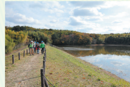
四季折々の景色が楽しめるので、ゆっくり散策するのもおすすめです

猪高緑地で増えすぎている竹を里山保全グループが年間5000～6000本伐採。炭焼きグループが市内に3カ所しかないという炭焼き場で竹炭を焼き、竹クラフトグループが竹玩具づくりを行うなど有効利用しています。ほかにも、自然観察会や棚田での稲作、近隣の小中学校の総合学習に協力するなど、地域の人との交流も大切な活動のひとつです。