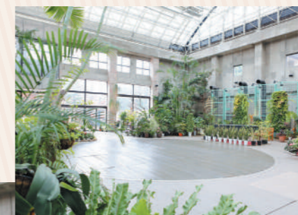
室内なので天気の心配がいらないのがポイント。天井も高くて明るい！