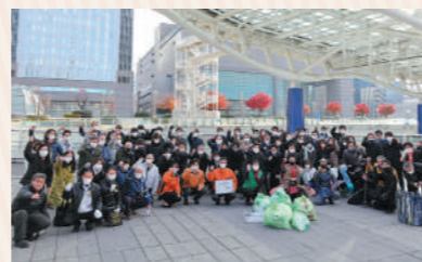
この日も約100人が参加。「まちがキレイになると、心も元気になります」と参加者の充実感も高い活動です

名古屋おもてなし武将隊や地元アイドルをはじめ、毎回約100人が参加。清掃道具を貸出してくれるので、思い立ったら参加できるのが魅力です。「はじめて参加しましたが、清々しい気持ちになりました」「出勤前に毎回参加しています。気軽に社会貢献できるのがいいですね」と参加者もみんな笑顔です。予約などもないので、ボランティア活動の第一歩として一度参加してみませんか。