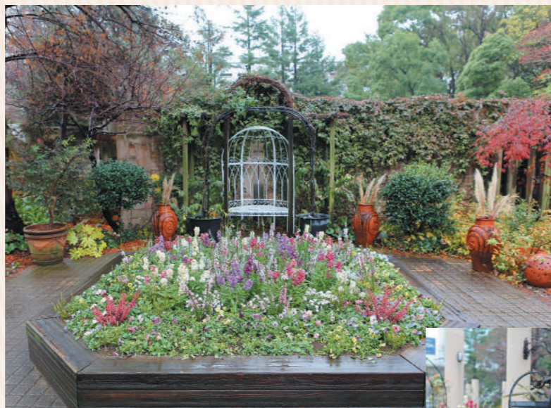
まさに都会のオアシス！ 色とりどりの花たちがお出迎えてくれます

まるで海外を旅しているような気分が味わえる洋風庭園。バラやハーブを主役とした、カラフルな花壇に癒されて。