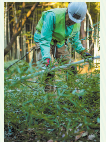
伐採した竹も貴重な資源。利用方法によって切り方も変わってきます

18年前、うちの裏に住んでいる人がこの代表をしていました。私は若い頃山ガールで、山野草が大好きだったので、森の整備を手伝っているうちに、いつの間にか竹を切っていました(笑)。「名東自然倶楽部」は1998年に設立され、現在は自然観察、竹クラフト、炭焼き、田んぼなど9つのグループがあり見学や体験もできます。安全面についてはボランティア保険に入ってもらいます。のこぎりなどは貸出しているので、まずは体験してみてください。