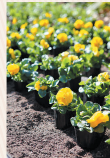
協賛いただいた花苗がズラリと並びます。春になればみんなの思いも満開に！