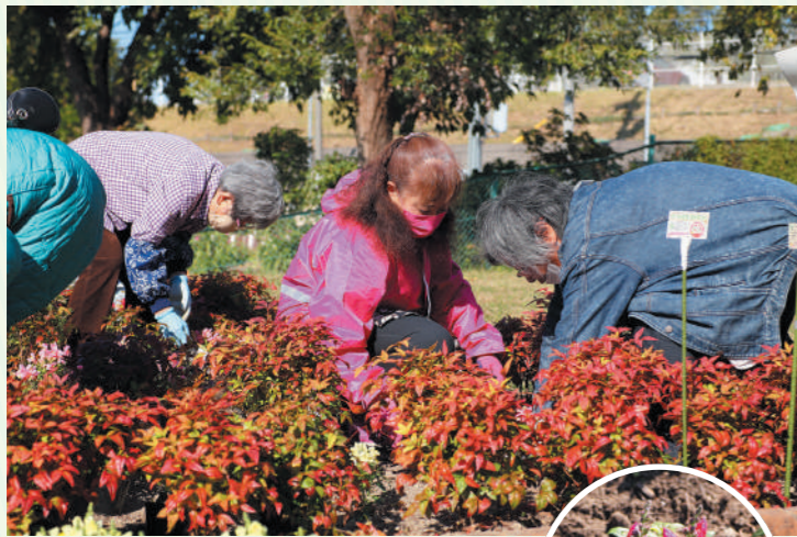
花の植え付けのようす。今回は、スイートアリッサムやキンギョソウ、パンジーなどを植えました