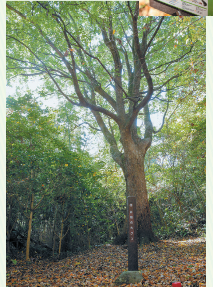
幹の周囲約4mという「井堰の大クス」は、圧倒的な存在感！