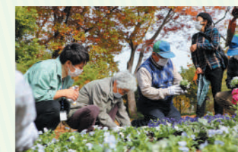
グループに分かれて花を植えていきます。花植えは初めてという人も

鶴舞公園の管理を行っているスタッフにアドバイスを受けながら、花壇で花植え体験。「噴水」をテーマにストックやピオラ、アリッサムなどを植えました。みんなで協力して、躍動感のある花壇ができあがりました。