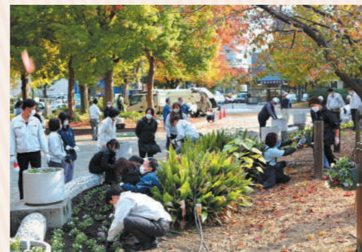
それぞれの持ち場にわかれて植えていきます