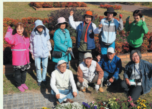
自分の都合に合わせて参加できるのが魅力です