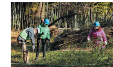
親子で花植え体験したり、森で木を切ったり、体当たりのレポートが話題を呼んでいます

市民レポーター「なごやグリーンアンバサダー」が、緑のまちづくり活動の楽しさや公園・緑の魅力を紹介。花植え体験や竹刈りなどにもチャレンジしています。