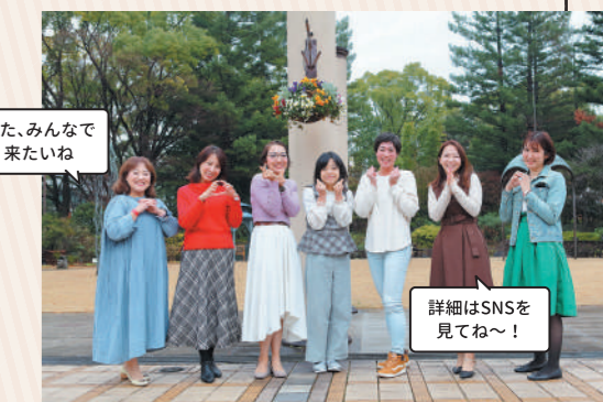
また、みんなで来たいね

クスノキをはじめとする高木に囲まれた広場では、ウエディングや屋外イベント、環境学習が行われています。