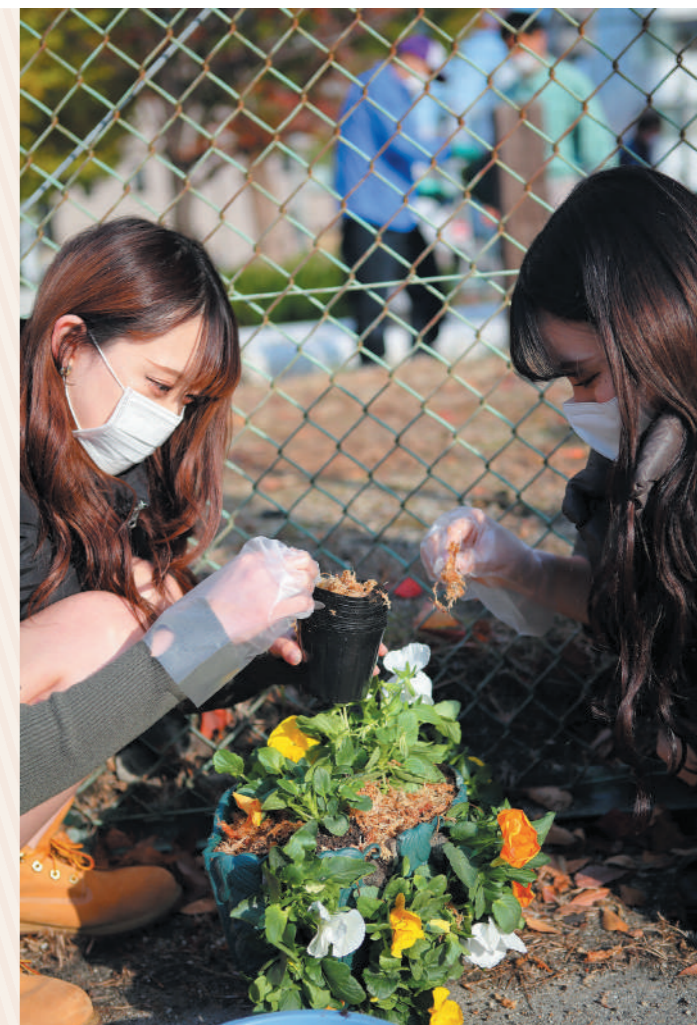
専門学校生や中学生も参加。「土に触ると気持ちいいですね！」

今回は、パンジーやノースポール、キンギョソウ、チューリップの球根などを植え付けましたが、毎回参加している方たちも多く、あっという間に完成！春には見ごろを迎えるので「毎日、成長のようすを見に来ます」という声も聞かれました。