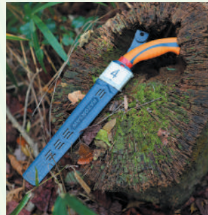
竹を切るのこぎりは、通常よりも刃が細かいそう