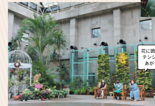
ガーデン内には、季節ごとの花と撮影できるスポットもあります

約600㎡の室内ガーデンでは、季節の花や観葉植物を楽しめるほか、イベントや講演会なども行われています。年に数回、ストリートピアノ「フラリエピアノ」を開催していると聞き「みんなで弾きに来よう！」とメンバーたちもノリノリに。その他、イベントの詳細はホームページで確認してください。