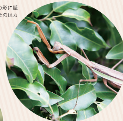
葉っぱの影に隠れていたのはカマキリ