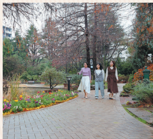
「身近にこんな素敵な場所があるって、知らなかった」というメンバーも。心地よい風を感じながらの散歩に会話もはずみます

久屋大通庭園フラリエ 名古屋市中区大須4-4-1 TEL 052-243-0511 http://www.flarie.jp/