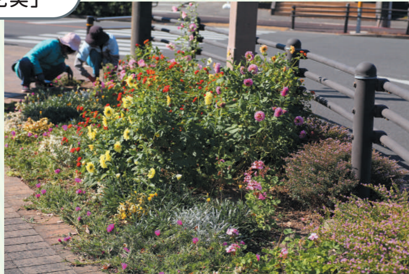
スポンサー花壇の手入れもサークル花実の活動のひとつ

緑区の新海池公園を拠点に活動している「サークル花実」は、花水緑の会の部会のひとつで結成して18年。現在は28人の会員たちが、苗の育成や花壇づくりなどを行っています。「サークルのみんなとおしゃべりするのが楽しみ」「キレイですねと、声をかけてもらうのがモチベーションになります」と、みなさんイキイキと活動しているのが印象的です。