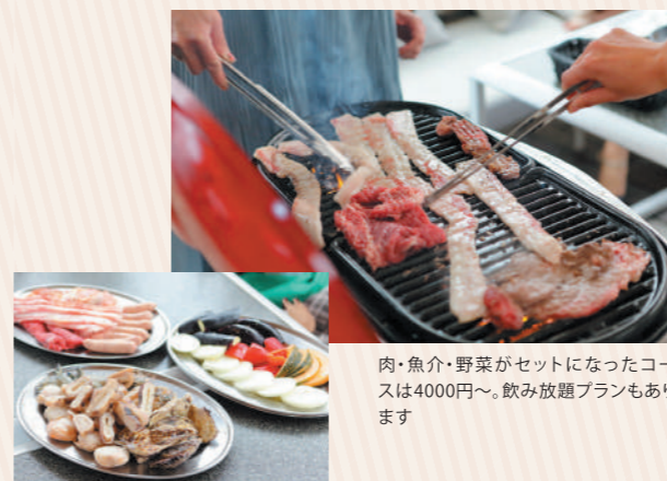
肉・魚介・野菜がセットになったコースは4000円～。飲み放題プランもあります

「ガーデンキッチンフラリエ」は、手ぶらでバーベキューを楽しめるダイニングレストラン。屋根があるので、雨の日でも楽しめるのが嬉しいですね。海外リゾートのようなインテリアや小物にも心躍ります。土・日曜、祝日ならお昼もオープンしているので、友達や家族と誘い合わせて出かけるのもおすすめです。