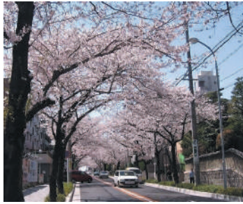
瑞穂区汐路桜ロード