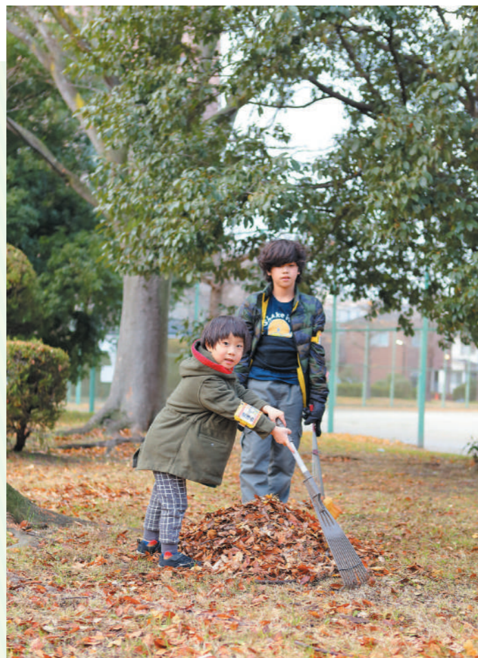
子どもたちも積極的にお手伝い。落ち葉掃除も手慣れたもの!

活動日 毎週月・木曜日 16:00～18:00 公園愛護会に関する問い合わせ 各区土木事務所