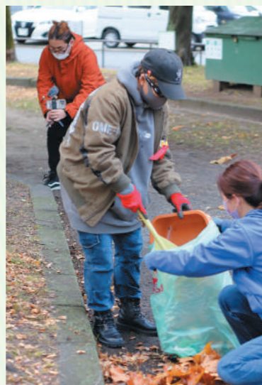
常時活動しているメンバーは現在9人。回覧板などで近所の人たちに声をかけることもあるそうです

「公園愛護会」は公園をきれいに保ち、安全で楽しく利用できるようにすることを目的に公園の地域住民が協力して活動するボランティア団体。名古屋市内にある約7割の公園で、愛護会のみなさんが活躍しています。