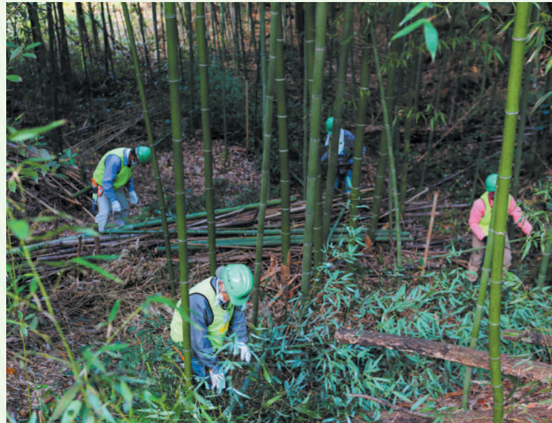
光の入る雑木林・竹林にするために枝を切っていきます