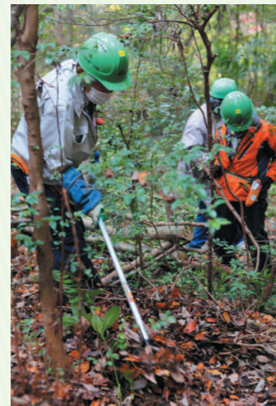
枯葉を取ることで土に雨が染み込み、湿地の乾燥が防げます

活動拠点である「里山の家」では、活動のようすやイベントなどの情報を発信しているほか、森の散策の仕方や自然観察のポイントも教えてもらえます。