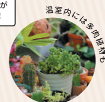
温室内には多肉植物も