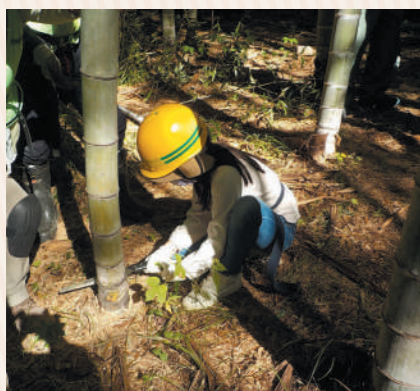
竹刈りに挑戦。子どもたちもあっという間にコツをつかんでいました

令和5年度の実施時期・内容は現在調整中ですが、広報なごや「くらしのガイド」でご案内をしますので、チェックしてください。