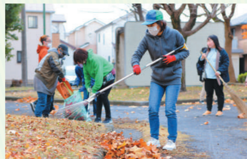
楽しみながら縁が広がればいいなという思いを込めて、「楽縁」という名前をつけました