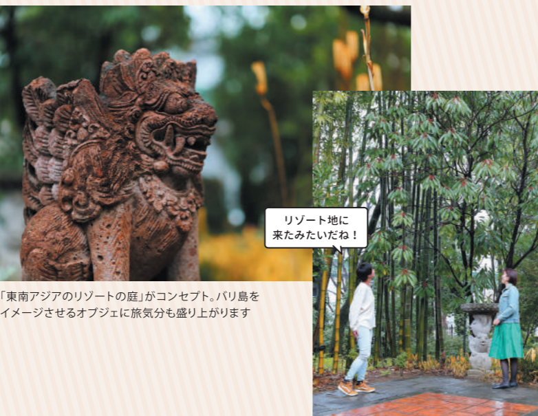
「東南アジアのリゾートの庭」がコンセプト。バリ島をイメージさせるオブジェに旅気分も盛り上がります

異国情緒あふれる空間に、「海外に来たみたい！」「これは何という木かな？」とメンバーも興味津々です。