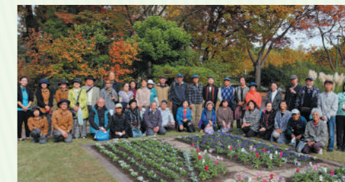
「満開になるのが楽しみ」と参加者のみなさん