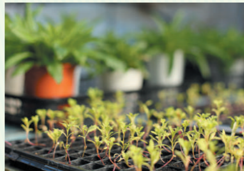
年間数万株の花を種から育てています。公園に植えるのはもちろん、イベント等で区民のみなさんに配布することもあります