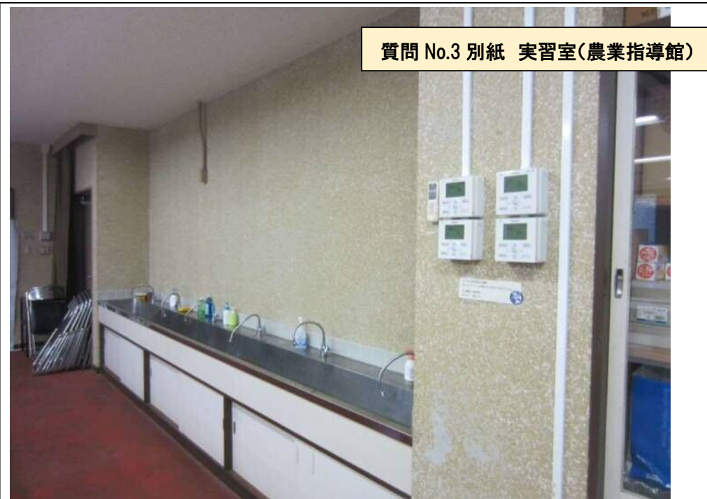
質問 No.3 別紙 実習室(農業指導館)