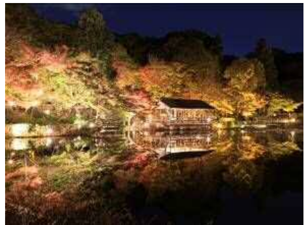
奥池の逆さもみじ