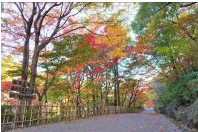
合掌線の五色もみじ