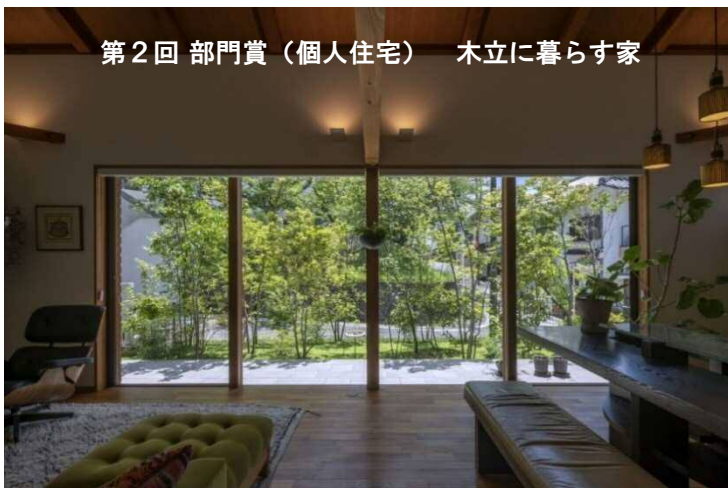
第2回 部門賞（個人住宅） 木立に暮らす家