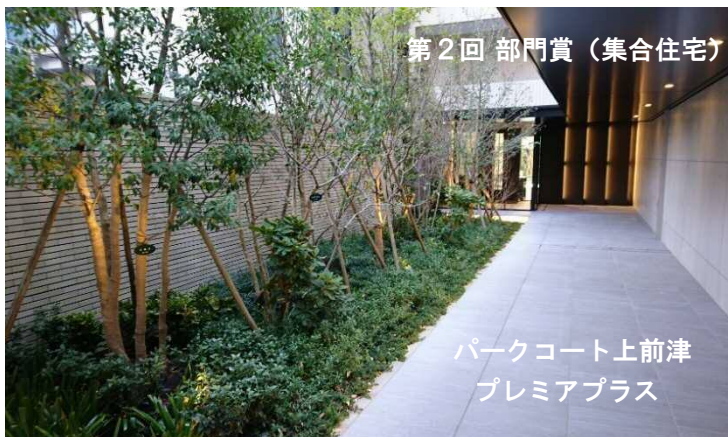
第2回 部門賞（集合住宅）