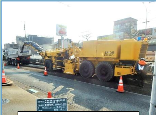
アスファルトを削り取っています