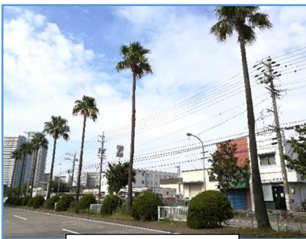
変更前のワシントンヤシ

金城埠頭線と稲永公園線は、名古屋市の特徴ある並木道として名称を「ヤシの道」と名付けており、「港町」や「南国」の雰囲気を出せるようヤシ類を植栽しています。これら路線の西稲永交差点～金城橋交差点、野跡交差点～稲永スポーツセンター交差点間のヤシの樹種を、ワシントンヤシからトウジュロに変更することにしました。