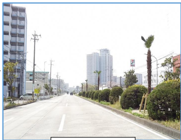
変更後のトウジュロ

今あるワシントンヤシは成長が早く、樹高が大きくなり過ぎたため、剪定などの維持管理が非常に難しくなっています。また、強風時には高い位置から大きな葉や樹皮が落下することがしばしばあり、危険性も増しています。一方、トウジュロも同シヤシ科ですが、成長が遅く葉が落下しにくいいため維持管理がしやすく、「ヤシの道」としての景観を守りつつ、危険性も軽減できます。