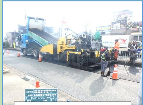
アスファルトを敷きならしています