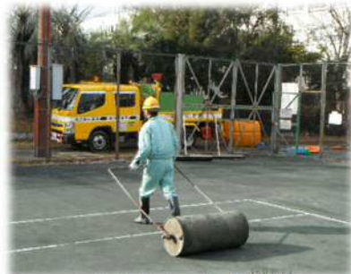
テニスコートの整備