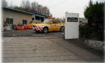
土木事務所入口とパトロールカー (上社小学校の北にあります)