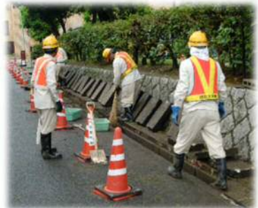
側溝の浚渫(泥などを取り除く)作業をしています。