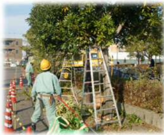
公園の樹木の剪定