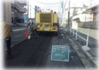
→ アスファルトを削りました →