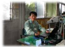
これは? 名東土木だより作っています。