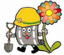
名古屋市緑政土木局 イメージキャラクター “どりょくん”

それから、公園で遊ぶ時は、ケガや事故のないよう、ゆずりあって楽しく遊んでください。また、ごみは持ち帰ってくださいね！