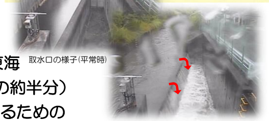
取水口の様子(平常時)