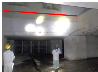
東海豪雨では赤線まで水が溜まりました