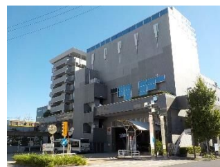
上社ターミナルビル

このように、大雨による水害から皆さんの暮らしを守るための施設は区内各所に設置されています。今後も順次紹介していきます。