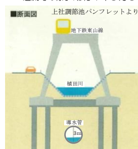
断面図 上社調節池パンフレットより