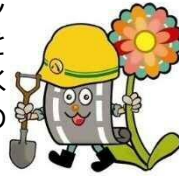
補修班イメージ キャラクター どりょくん

西土木事務所では毎年、区内のひび割れが発生している道路を順番に補修しています。今年度は約3,000mのひび割れ補修工事を実施しました。