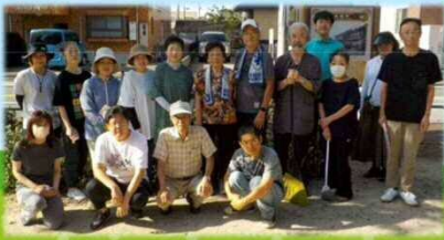
白菊公園特定愛護会のみなさま