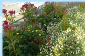
花がいっぱいのメイン花壇

設立：昭和48年11月 活動場所：西区 白菊公園 活動内容：月2回（毎月第2・4日曜日） 11・12月は毎週日曜日 各町内会で分担 清掃・草取り・花壇づくり 会員：300名（町内会）