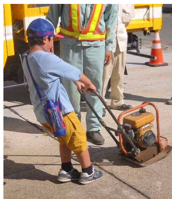
プレートコンパクター