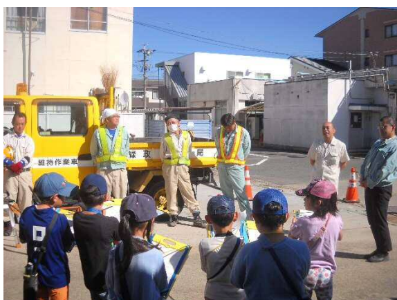
補修班の仕事を紹介

また、普段使用している道具・機械の紹介では、児童が実際に高枝ノコギリを持ち上げたり、プレートコンパクターを引きずったことにより、体感することができ、少しでも土木事務所の仕事に興味を持ってくれるといいと思いました。