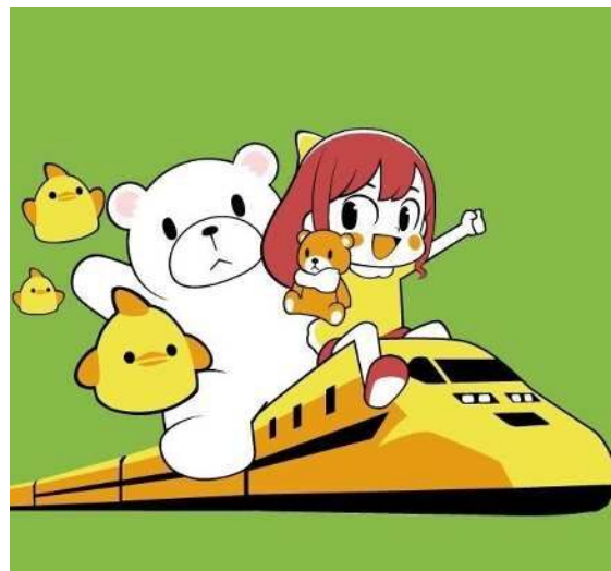
令和6年度のデザイン