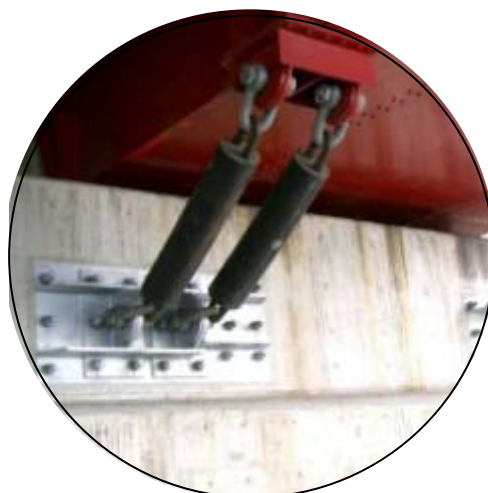
チェーンで結ぶタイプ