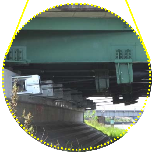
鋼線で結ぶタイプ