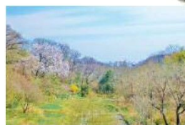
シダレザクラの里