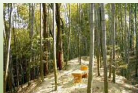
勢子坊の竹林風景