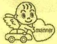
マスコットキャラクター マナーちゃん

◎12月は帰省や買い物などで車を利用する機会が多くなります。無理な割り込みや急な車線変更を避け、他の車に道を譲るなど思いやり運転を心がけましょう。