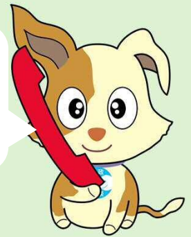
行政相談マスコット「キクーン」

困っていることがあるけど、国のことか、県や市のことか分からない時も相談できるよ。