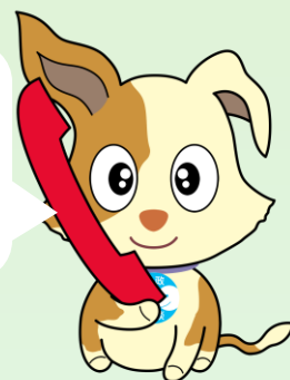
行政相談マスコット「キクーン」

困っていることがあるけど、国のことか、県や市のことか分からない時も相談できるよ。