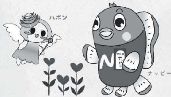
中川区マスコットキャラクター 「ハボン」「ナッピー」