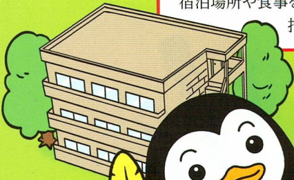
更生ペンギンの ホゴちゃん

刑務所等を出た後、帰る場所がない人たちに宿泊場所や食事を提供し、自立に向けた生活指導を行う民間の施設です。