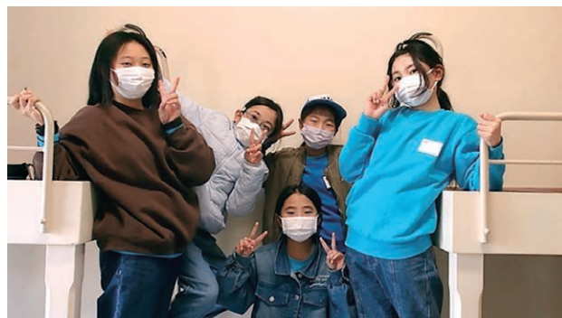
2段ベッドの階段です。イエーイ！