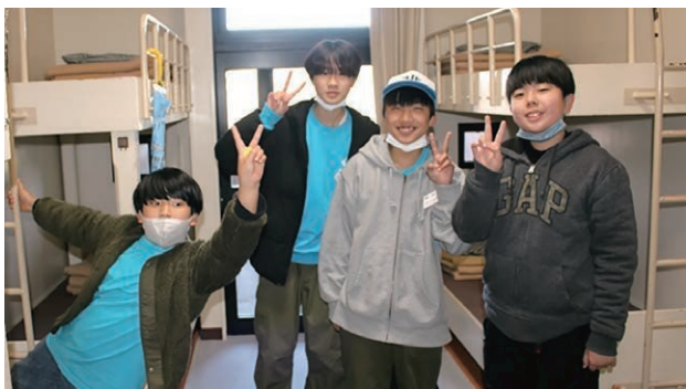
ぐっすり眠れてすがすがしい朝です。ピース！

薪を割って火起こししたり、食材を切って鍋に入れたり、けむいけど楽しかったね。みんなで食べるからうまい。片付けも悪戦苦闘しながらピッカピカにしたね。気持ちい～。