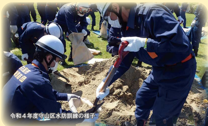
令和4年度守山区水防訓練の様子

災害対策委員 News とは 市の防災対策に関して、地域と本市との橋渡し役をお願いしている災害対策委員（区政協力委員が兼務）の皆様、防災に関する情報をこの News で定期的にお届けいたします。