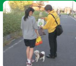
飼主等への啓発活動