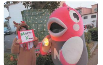
ナッピーのふれあい活動