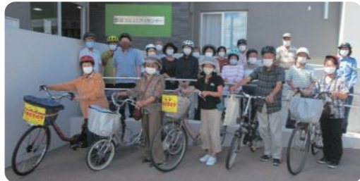
豊治学区自転車ヘルメット広め隊の皆さん

・「自転車ヘルメット広め隊」の啓発活動を通じて、自転車交通死亡事故の抑止につなげます。