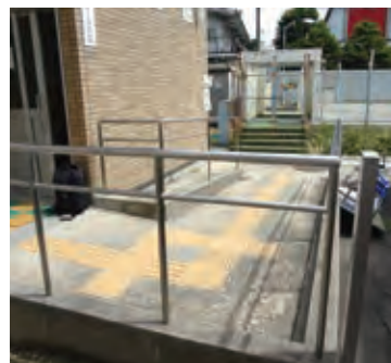
長須賀コミュニティセンター 入りぐち 入口スロープ

長須賀小学校 長須賀小学校 福祉避難スペース 長須賀小学校 トワイライトルーム 長須賀小学校 トワイライトルーム 車いす対応トイレ