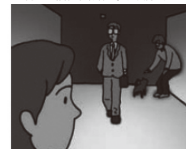
クラスB+ 4m先の道路端の歩行者の挙動・姿勢が分かる。