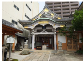
③ 天寧寺 (三宝殿前)