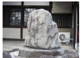
⑤ 長栄寺 (横井也有蘿塚)