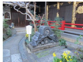
④ 栄国寺 (本堂の鬼瓦)