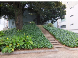
① 那古野山古墳 (古墳)