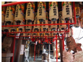
② 万松寺 (身代り不動明王)