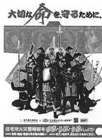
<B2・B3・A3 サイズポスター>