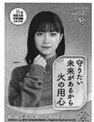
<B2・B3 サイズポスター>