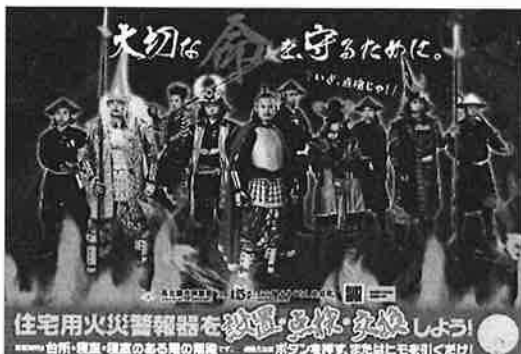
<B3・A3 サイズポスター>