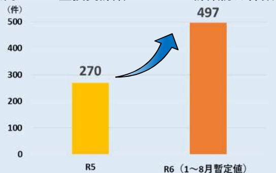
県内のSNS型投資詐欺・ロマンス詐欺認知件数

SNSなどを通じて関係を深めて信用させ、投資すれば利益を得られると言って金銭をだまし取るもの