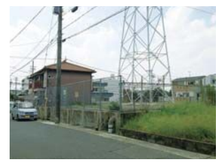
① 米田城跡 (築田が城跡)