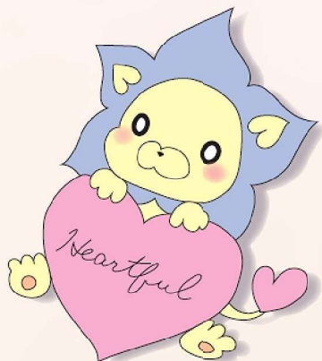
ハートフルもりやま マスコットキャラクター モリオン