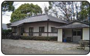
唐九郎(翠松園陶芸)記念館