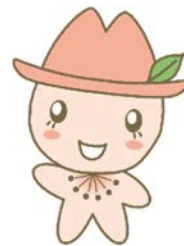
瑞穂区マスコットキャラクター みずほっぺ