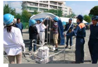
【仮設トイレ組立訓練】