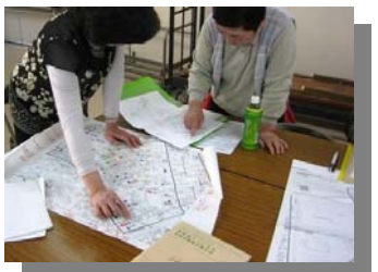
【地域支えあいマップづくり】