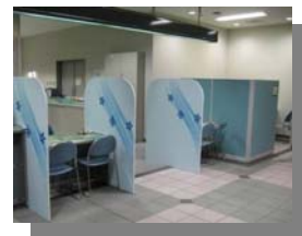
【仕切り板を設置した 保険年金課相談ブース】