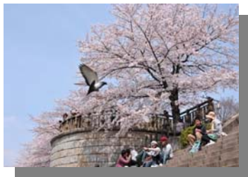
山崎川の桜 (平成22年度瑞穂のさくら写真展 さくら大賞「春うらら」)