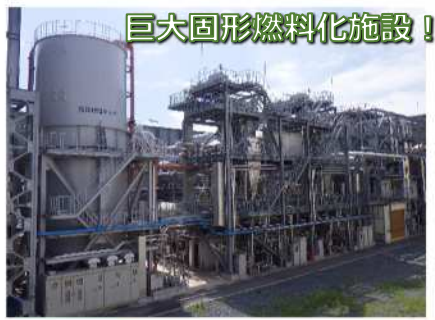
巨大固形燃料化施設!