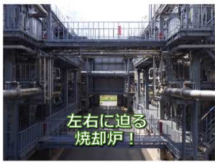
左右に迫る 焼却炉!