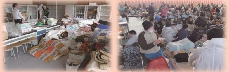
【東日本大震災当時の陸前高田市の避難所の様子】

指定避難所の基本的な考え方は、避難者による「 自主運営 」となります。災害の備えとして市公式ウェブサイトや指定避難所に設置してある「指定避難所マニュアル」を確認しましょう。