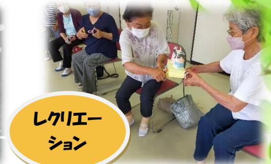
レクリエー ション