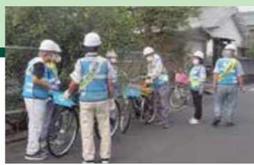
防犯パトロール(神宮寺学区)

地域や警察署等と協働して啓発活動を行い、区民一人ひとりの防犯意識の向上に取り組みます。 ・防犯キャンペーンや防犯教室の開催 ・防犯カメラ設置や防犯灯のLED化支援 ・特殊詐欺に関する防犯講話の実施 ・防犯カメラ設置や防犯灯のLED化支援