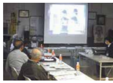
「地区防災カルテ」を活用した話し合い(東海学区)

地区防災カルテ(※)を活用した防災活動の推進 「地区防災カルテ」を活用した話し合いを、地域住民と行政(区役所、消防署)で進めます。地域の防災組織の機能強化を図るため、地域課題やニーズに応じた防災訓練等の実施を支援します。 (※)災害リスク等の地域特性や地域の防災活動状況を学区毎に整理したデータベース