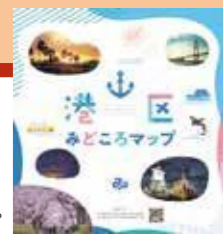
港区みどころマップ