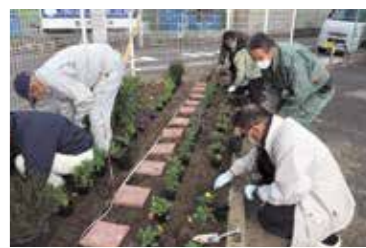
港区役所いきいき高齢者プロジェクト

高齢者が住み慣れた地域で安心して生活できるようにするため、認知症サポーター等により構成される「港区認知症になっても安心して暮らせる町をつくり隊」の活動や、地域での社会参加の場づくりとして、公共のスペースでの花壇づくりを行う「港区役所いきいき高齢者プロジェクト」を推進・支援するなど、地域包括ケアシステムを推進します。