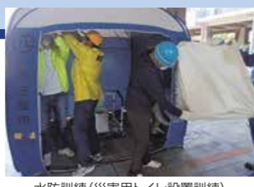
水防訓練(災害用トイレ設置訓練)