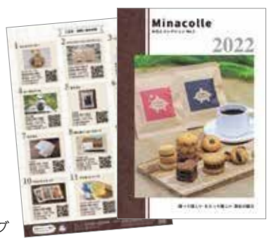
授産製品カタログ

授産製品の販売を促進するため、「みなとーり」及び「みなとーり南陽支店」の設置や、授産製品カタログを作成・配布します。 ヘルプカードの周知を図るとともに、吊り下げケースを用いた活用について支援します。