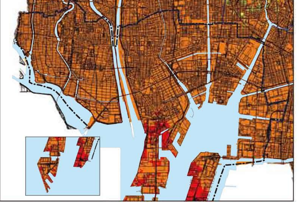
あらゆる可能性を考慮した最大クラス