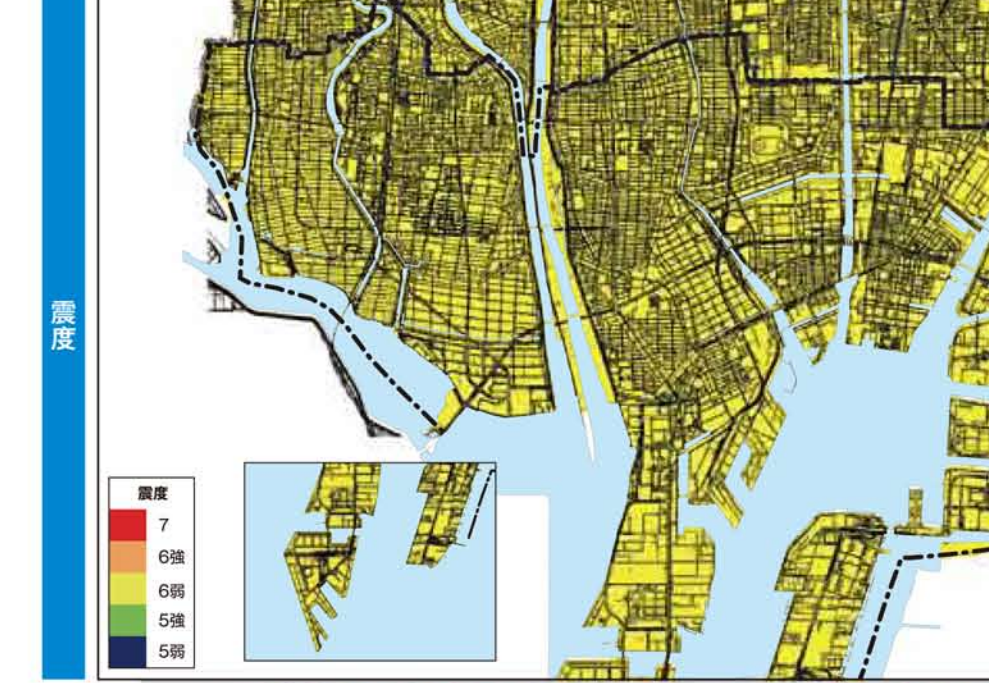
過去の地震を考慮した最大クラス