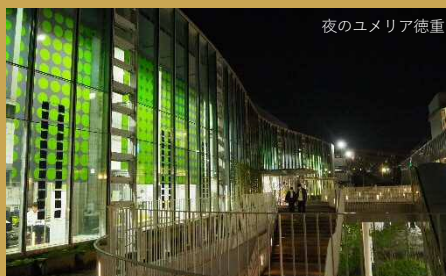
夜のユメリア徳重