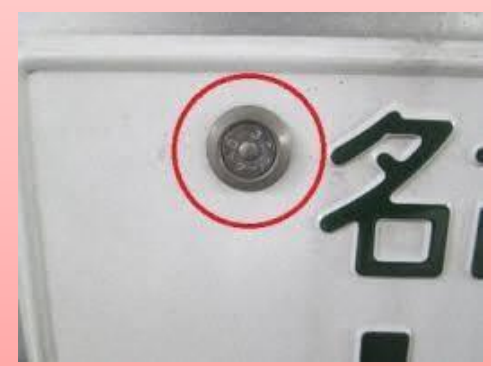
ナンバープレート盗難防止ねじ