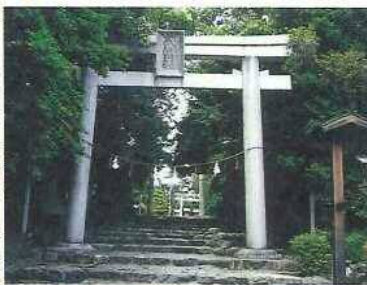
27 古鳴海八幡社(こなるみはちまんしゃ)