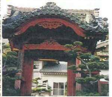
17 一国山 光明寺(こうみょうじ)(子安地藏)