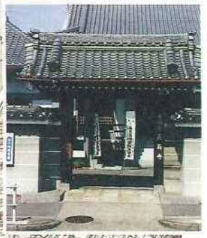
14 白狐山 長翁寺(ちようおうじ)(織田紫雲)