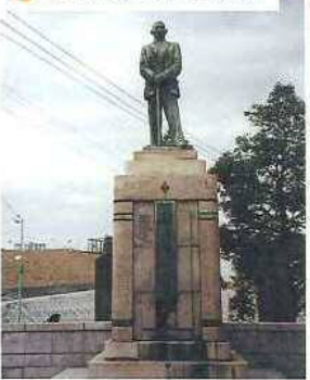
21 雉本朗造博士銅像