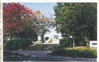
6 庚申山 円道寺(えんどうじ)(庚申堂)