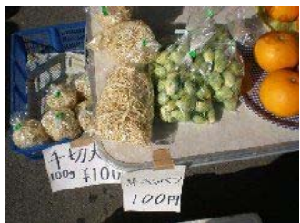
切干大根・芽キャベツ・はっさく