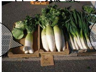
キャベツ・大根・ねぎ