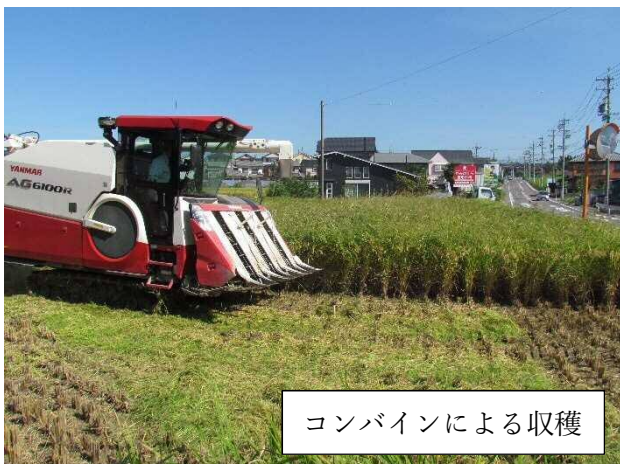
コンバインによる収穫

わざわざ手作業で時間をかけて行うのは、JAが、農業を知らない人たちにも、コメづくりを知って欲しいという思いから行っているのだそうです。