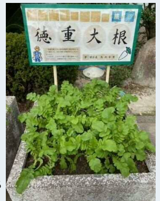
区役所のプランターでも栽培しています!

途絶えたとされていた徳重だいこん。今回、たくさんの方達の尽力によって伝統野菜に認定されました。最近は区内の飲食店で徳重だいこんを使用したメニューが提供されるなど、新たな広がりも見せています。伝統野菜の先輩「大高菜」と共に、地元が誇る、長く愛される野菜になって欲しいです。