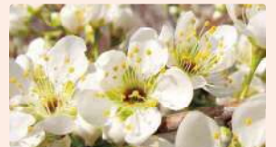
スモモ | 3月中旬