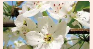
ナシ | 4月上旬～中旬