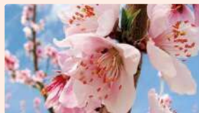
モモ | 3月下旬～4月上旬