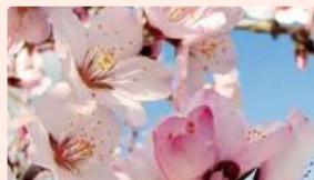
アーモンド | 3月中旬～下旬