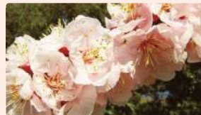
アンズ | 3月上旬～中旬