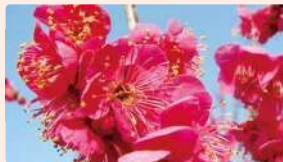
ウメ | 2月中旬～3月中旬

3月から4月にかけて、順次園内を彩る ウメ、アンズ、スモモ、アーモンド、モモ、 ナシの花をお楽しみいただけます。