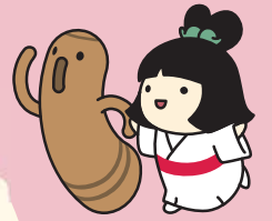
はにわらじをはく 地輪氏武 しだみこちゃん おかしなと「歴史の里」マスコットキャラクター