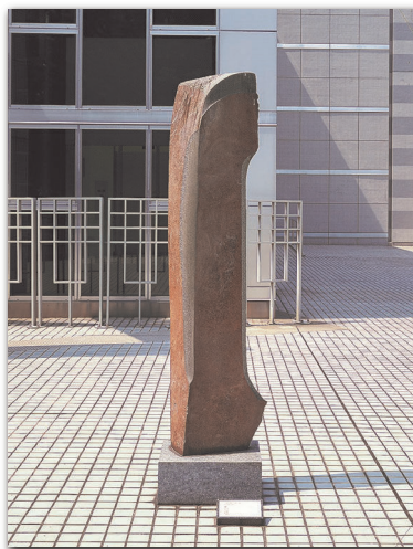
イサム・ノグチ《魂》1982年