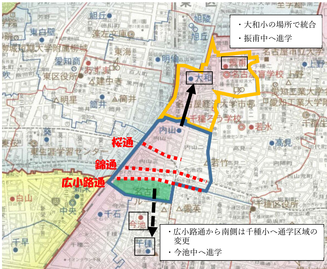
※この地図の作成にあたっては、名古屋市学校配置図の一部を使用し、複製した。(東洋地図株式会社承諾済)