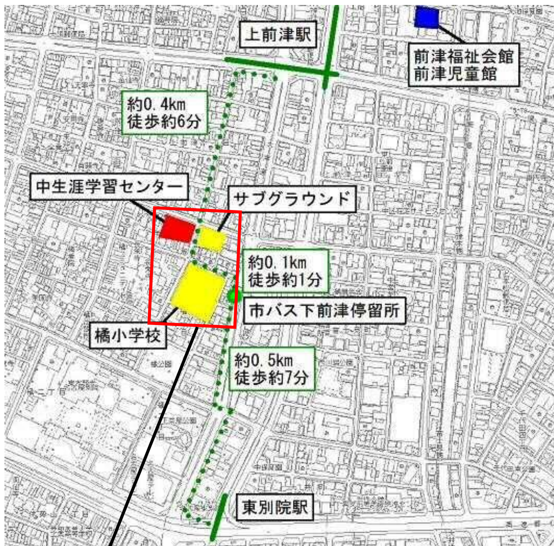
橘小学校敷地及び周辺図