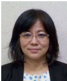
船 津 委 員