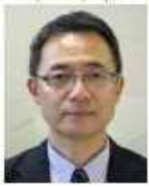
杉 崎 教 育 長