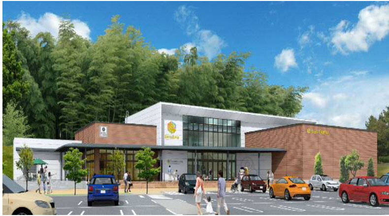
(「体感！しだみ古墳群ミュージアム」外観イメージ)